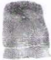
Otisk palce pravé ruky